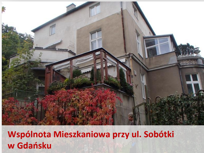
Wspólnota Mieszkaniowa przy ul. Sobótki w Gdańsku