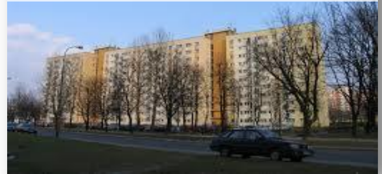
Wymiana instalacji centralnego ogrzewania oraz modernizacja instalacji ciepłej wody użytkowej w budynku przy ul. Broniewskiego 95 w Warszawie