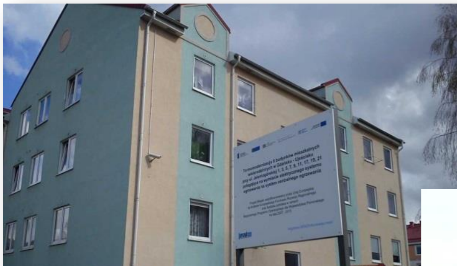
Termomodernizacja 9 budynków mieszkalnych wielorodzinnych w Gdańsku - Ujeścisku przy ul. Jeleniogórskiej