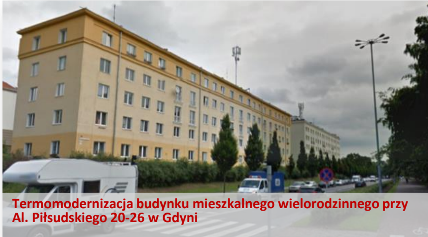
Termomodernizacja budynku mieszkalnego wielorodzinnego przy Al. Piłsudskiego 20-26 w Gdyni