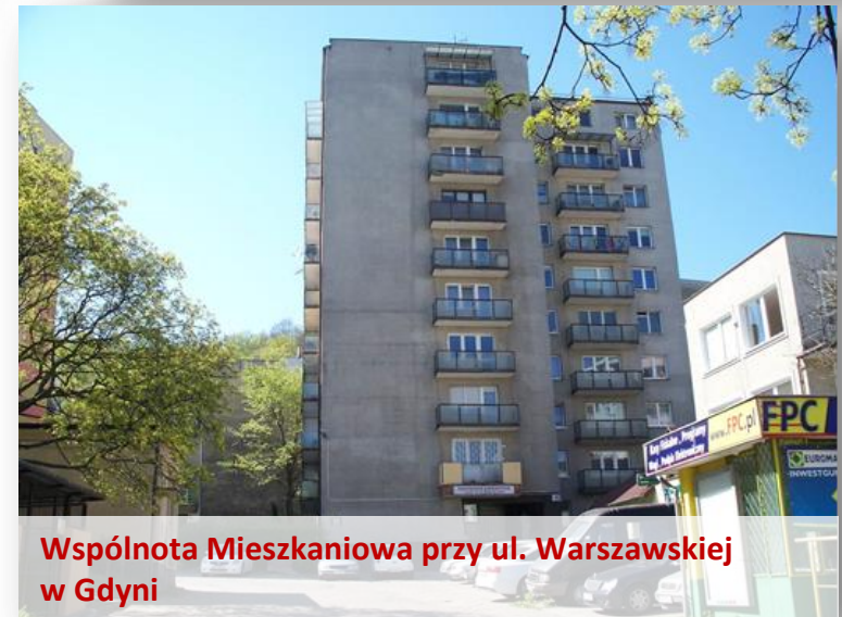
Wspólnota Mieszkaniowa przy ul. Warszawskiej w Gdyni