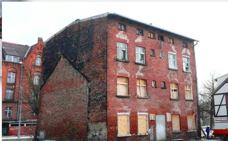
"Kieturakisa" – Rewitalizacja budynku mieszkalnego z przełomu XIX i XX wieku na Dolnym Mieście w Gdańsku wraz ze zmianą sposobu jego użytkowania